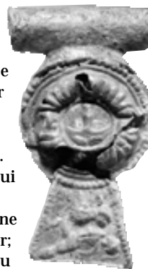
Fibule avec scène d'amphithéâtre et médaillon à tête humaine, 1 re moitié du I er siècle apr. J.-C., alliage cuivreux, longueur 4,5 cm.

La disposition de la tête en médaillon, ainsi que celle des protagonistes du combat, vient confirmer que les fibules étaient d'habitude portées soit horizontalement, soit avec le pied dirigé vers le haut.