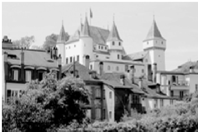
Le château vu depuis la rue de la Porcelaine.

Vincent Lieber, conservateur du Musée historique