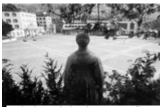
Au haut de la place, trône fièrement «la Catherine», monument controversé édifié pour le 100 e anniversaire de l'entrée du Valais dans la Confédération.