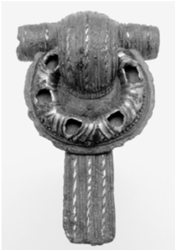
Grande fibule «à queue de paon», 1 re moitié du 1 er siècle apr. J.-C., alliage cuivreux, longueur 4,8 cm.