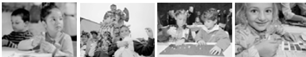
Sous l'ombre de Jules César, des enfants remontent le temps et découvrent en s'amusant «nos ancêtres les Romains», ateliers durant les vacances scolaires d'octobre.

Véronique Rey-Vodoz, conservatrice du Musée romain