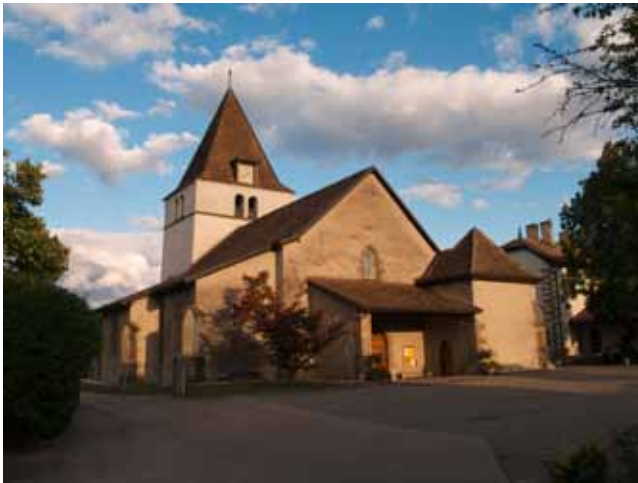
L'église de Commugny

Le destin a voulu qu'Hérald Chatelain soit lié à mon parcours personnel depuis l'enfance. Pasteur à l'église de Commugny, mon village, il accompagnait avec une honnêteté absolue, sans esquiver la moindre question embarrassante, des catéchumènes un peu frondeurs sur le chemin de l'éveil spirituel. C'est d'ailleurs à cette époque, je ne l'ai réalisé que bien plus tard, qu'il se passionna pour la villa romaine dont les vestiges, invisibles à l'œil mais déterminants pour l'archéologie, se déployaient sous ses pas. Tant la cure où il vivait avec son épouse et ses trois filles, que l'église où il prêchait, le cimetière où il accompagnait les défunt-e-s et la salle de paroisse où se tenaient diverses réunions, avaient remplacé, au fil du temps, les portiques, les salles de réception, la cour intérieure, les thermes, les chambres à coucher et les locaux de service d'un luxueux domaine construit dès le premier tiers du 1 er siècle apr. J.-C.