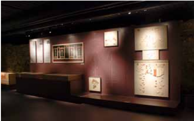
Les peintures murales de la villa de Commugny au Musée romain. L'ensemble à droite de la photo a été trouvé par H. Chatelain.

Hérald Chatelain fut aussi membre du groupe de travail chargé d'établir le choix des objets et des thématiques à présenter dans le nouveau Musée romain inauguré en 1979. Plusieurs objets qui font l'intérêt et la beauté des collections du Musée, dont des magnifiques peintures murales, proviennent du site de Commugny ; certains ont été découverts par Hérald Chatelain lui-même.